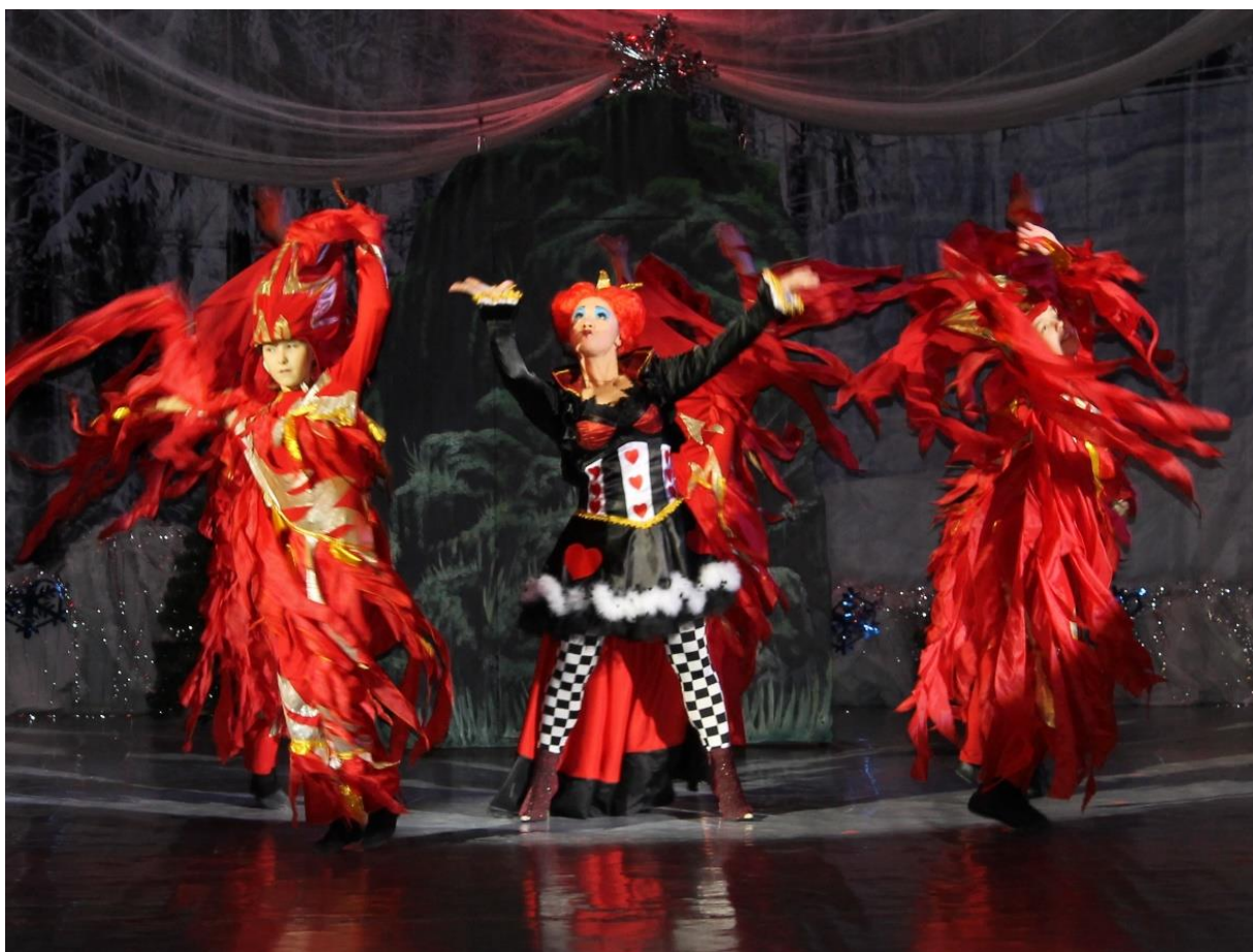
Пластический этюд «Пауки» Танец Красной королевы и ее свиты (огней).

Выключается полностью свет. Выносят каменную пещеру.